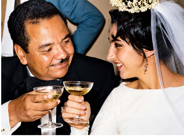
Alvaro Carrillo brinda junto a la cantante Eydie Gormé. La intérprete ayudó a popularizar internacionalmente el bolero “Sabor a mí.” Alvaro Carrillo toasts with singer Eydie Gormé. The singer helped popularize the bolero “Sabor a mí” internationally.

La canción romántica del compositor mexicano Alvaro Carrillo continúa conquistando generaciones más de seis décadas después de su creación