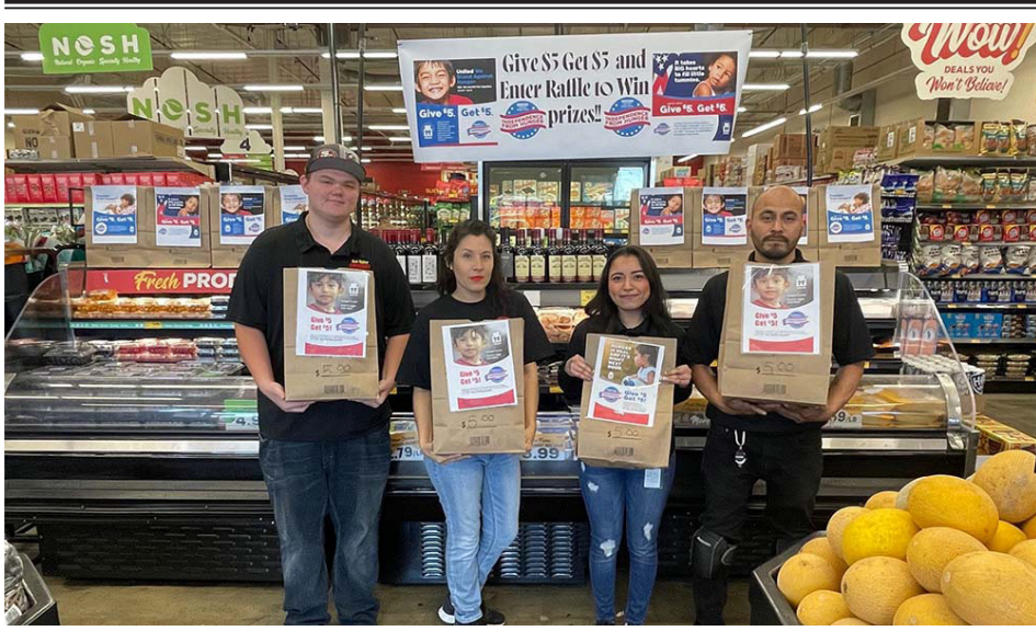
Empleados de Grocery Outlet promueven campaña contra el hambre con donaciones comunitarias. Grocery Outlet employees promote anti-hunger campaign through community donations supporting local families.