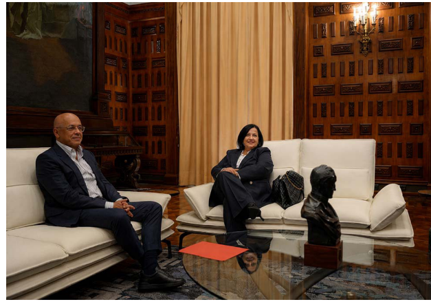
Dinorah Figuera y Jorge Rodríguez acordaron crear una comisión técnica y política para impulsar reformas democráticas e institucionales. Dinorah Figuera and Jorge Rodríguez agreed to create a technical and political commission to advance democratic and institutional reforms.