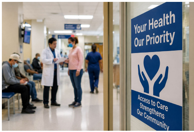
Pacientes esperan atención mientras clínicas enfrentan crecientes desafíos financieros por reducción de fondos. Patients await care as clinics face growing financial challenges from