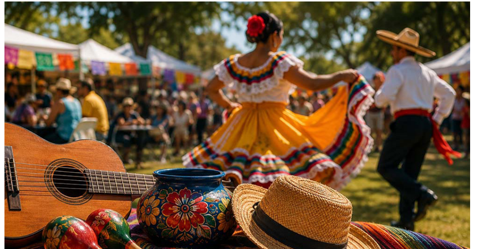
Música - Cultura- Comunidad-- Music - Culture - Community