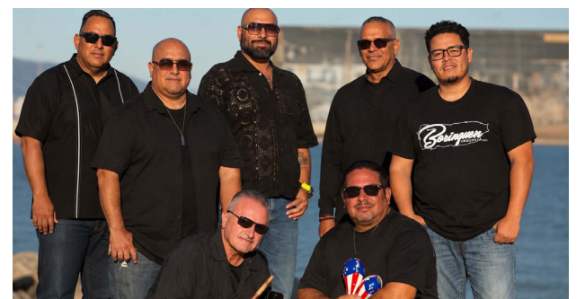
Grupo Orquesta Borinquen.

Weekly salsa dancing continues at Blondie’s Bar in San Francisco’s Mission District, where live Latin bands and DJs gather dancers from across the Bay Area every Wednesday evening. Organizers say the popular Valencia Street venue continues at-