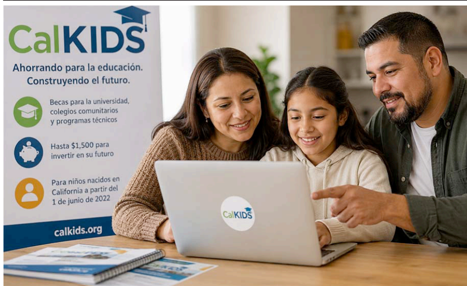
Familia latina explora beneficios educativos a través del programa de becas CalKIDS financiado por el estado de California. Latino family explores educational benefits through California's state-funded CalKIDS scholarship program.