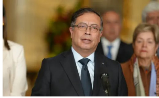
Presidente de Colombia Gustavo Petro.

Today, garlic is available in many forms including raw cloves, powders, oils and aged garlic extracts sold as dietary supplements. Some clinical trials have focused specifically on aged garlic extract, which researchers believe may provide cardiovascular benefits while reducing some of the stomach irritation associated with raw garlic. Ongoing clinical trials continue examining whether aged garlic extract could help slow plaque buildup in arteries.