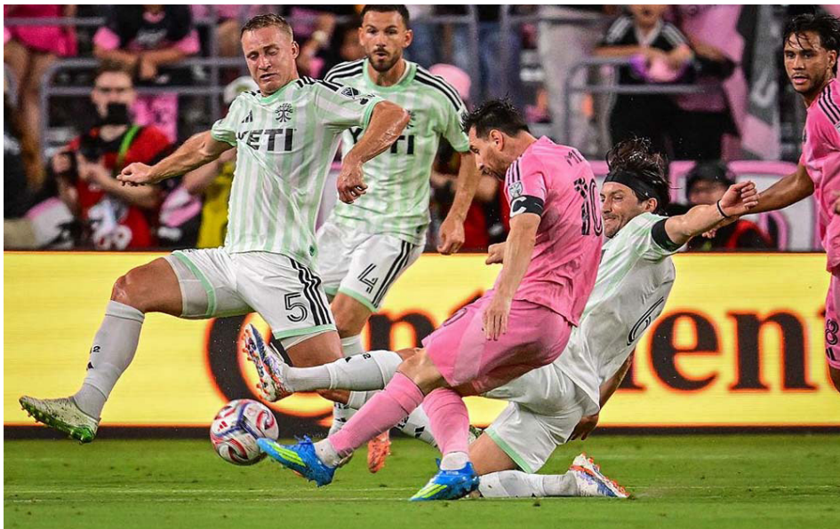
Lionel Messi lidera ataque del Inter Miami ante intensa presión rival. Lionel Messi leads Inter Miami attack against intense pressure from rivals.