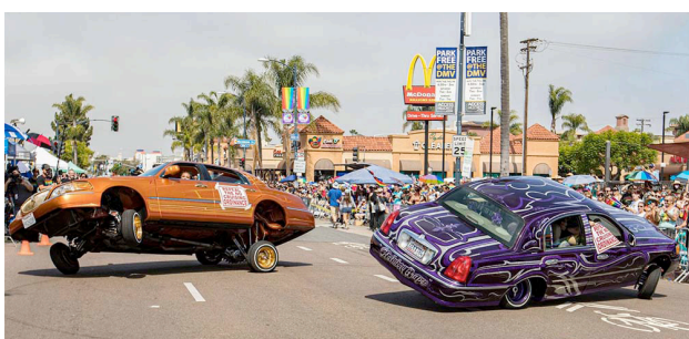
ARTE de la página 4

Beyond statistics, this year's draft carries cultural significance, as Latino athletes continue to gain recognition and inspire younger generations across the United States to pursue football opportunities and careers at higher levels.