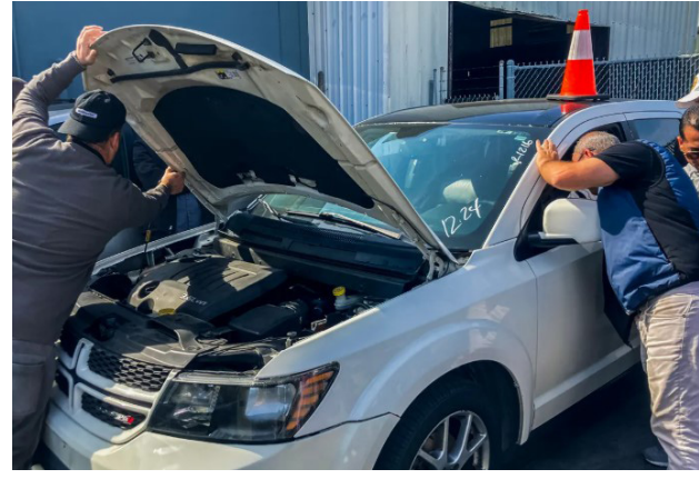
Varias personas inspeccionan un vehículo en una subasta en Bruffy's Tow en Marina Del Rey el 18 de febrero de 2025. People inspect a vehicle at an auction at Bruffy's Tow in Marina Del Rey on Feb. 18, 2025.

Advertise your business in El Reportero and help build a free press. Call us at 415-648-3711