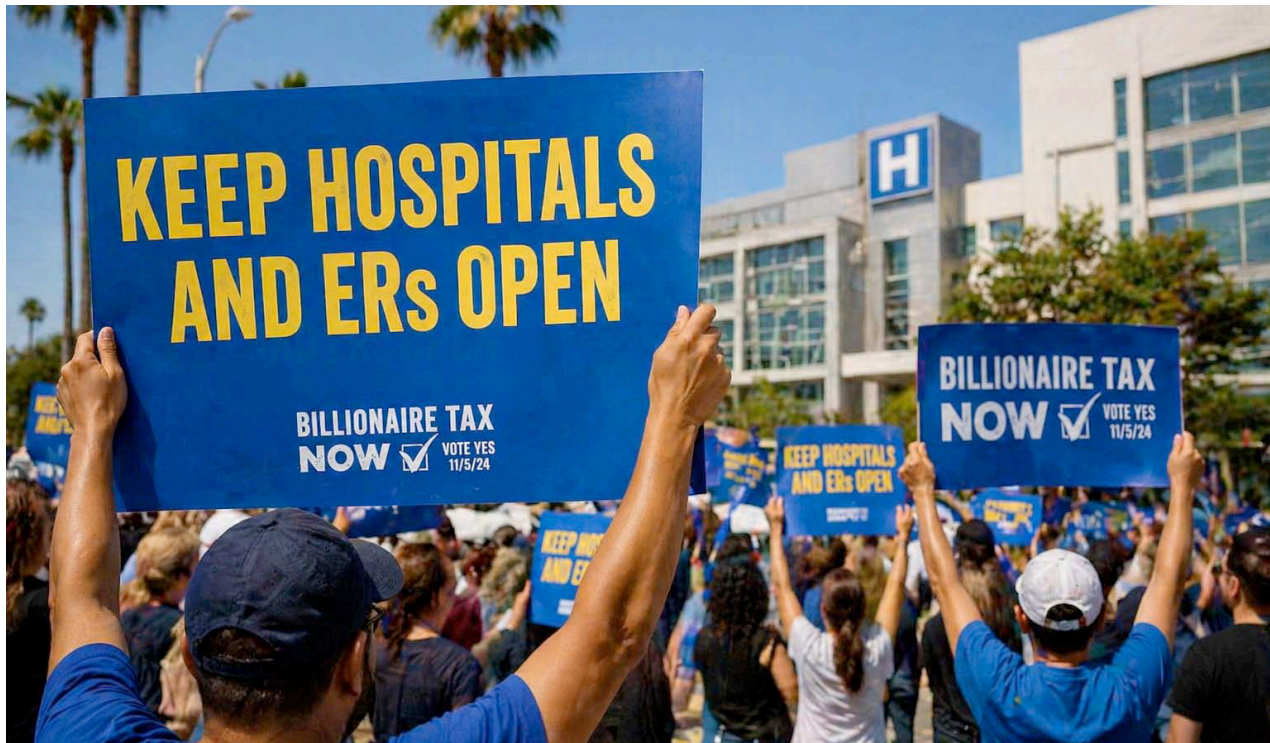
Los manifestantes portan carteles en apoyo a la financiación hospitalaria y a impuestos sobre propiedades de lujo, destacando tensiones por el "impuesto a las mansiones" en Los Ángeles. Protesters hold signs supporting hospital funding and taxes on luxury property sales, highlighting tensions surrounding Los Angeles' "mansion tax" and a proposed statewide reform measure.