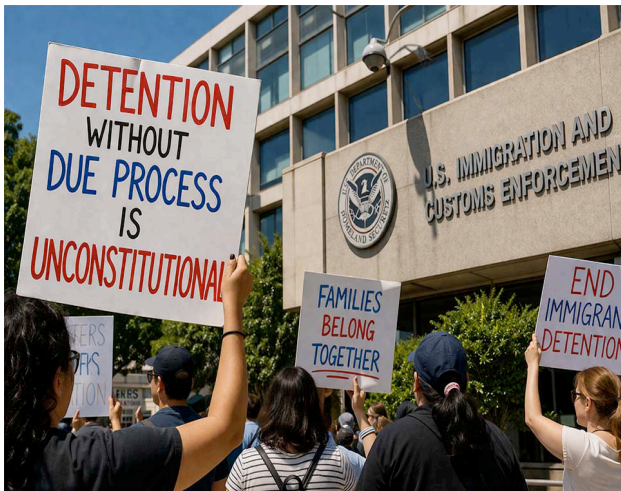
Manifestantes protestan contra detención migratoria frente federal. Protesters rally against immigration detention outside.