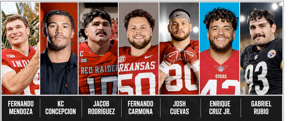
Siete jugadores latinos seleccionados en el Draft NFL 2026 reflejan creciente presencia hispana en la liga. Seven Latino players selected in the 2026 NFL Draft highlight rising representation and impact across the league, showcasing talent and diversity overall today.