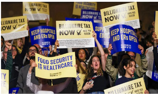
Asistentes aplauden durante discurso del senador Bernie Sanders en lanzamiento de campaña del impuesto a multimillonarios en Los Ángeles, febrero 2026. Attendees cheer during Sen. Bernie Sanders speech at campaign kickoff for California billionaire tax in Los Angeles, February 2026.