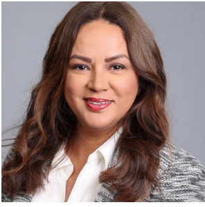
Patrocinado por JPMorganChase

Todos tenemos metas y necesidades financieras, ya sea comprar una casa, comenzar un negocio o simplemente sentirnos más tranquilos con nuestro dinero. No importa en qué etapa estés, nunca es demasiado pronto ni demasiado tarde para empezar.