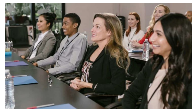
La Cumbre de Política Empresarial de California discute las necesidades de las pequeñas empresas y comunidades emergentes de California. The California Business Policy Summit discusses the needs of California’s small businesses and emerging communities

California Business Policy Summit 2026 As in previous years, the California Business Policy Summit will take place in 2026, bringing together legislators, business leaders, and commu-