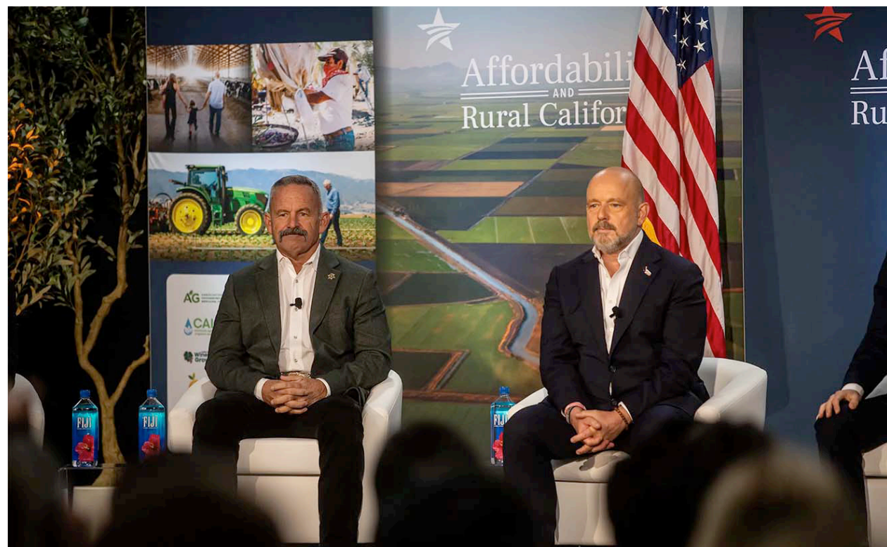
(De izquierda a derecha) Los candidatos republicanos Chad Bianco y Steve Hilton participan en el foro de candidatos a la gobernación de California de Western Growers en Fresno State, el 1 de abril de 2026.