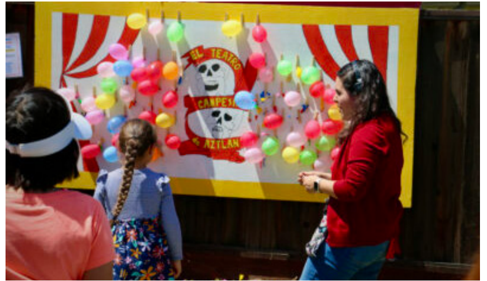
Este 26 de abril disfruta con tu familia de El Teatro Campesino. Enjoy El Teatro Campesino with your family this April 26th.