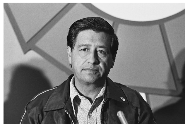
César Chávez durante una conferencia de prensa en el Reino Unido el 17 de septiembre de 1974. César Chávez during a press conference in the United Kingdom on Sept. 17, 1974.

Las acusaciones reportadas en The New York Times de que César Chávez, líder laboral y posiblemente el latino más famoso en la historia de Estados Unidos, abusó sexualmente y violó a niñas y jóvenes, resultarán impactantes para muchos estadounidenses. Para otros, especialmente las víctimas, esta revelación inicia un camino hacia una justicia largamente esperada. También ilustra lo que las