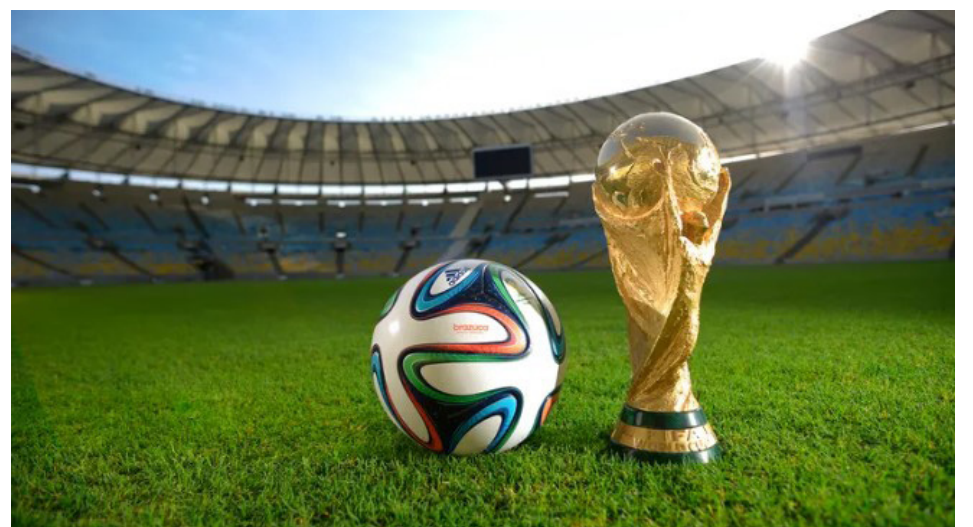
Vista general de Brazuca y el trofeo de la Copa Mundial de la FIFA. A general view of Brazuca and the FIFA World Cup Trophy