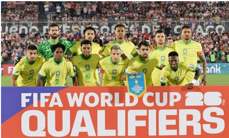
La selección nacional de Brasil se alinea durante un partido de las eliminatorias para el Mundial de 2026. The Brazilian national team lines up during a match in the 2026 World Cup qualifiers.