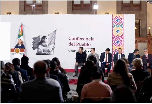
La presidenta Sheinbaum confirmó el lunes que su administración dice a los gobiernos de Estados Unidos y Cuba que México está “siempre” dispuesto a hacer lo que pueda “para evitar cualquier conflicto”. President Sheinbaum confirmed on Monday that her administration tells the governments of both the United States and Cuba that Mexico is “always” ready to do what it can “to avoid any conflict.”