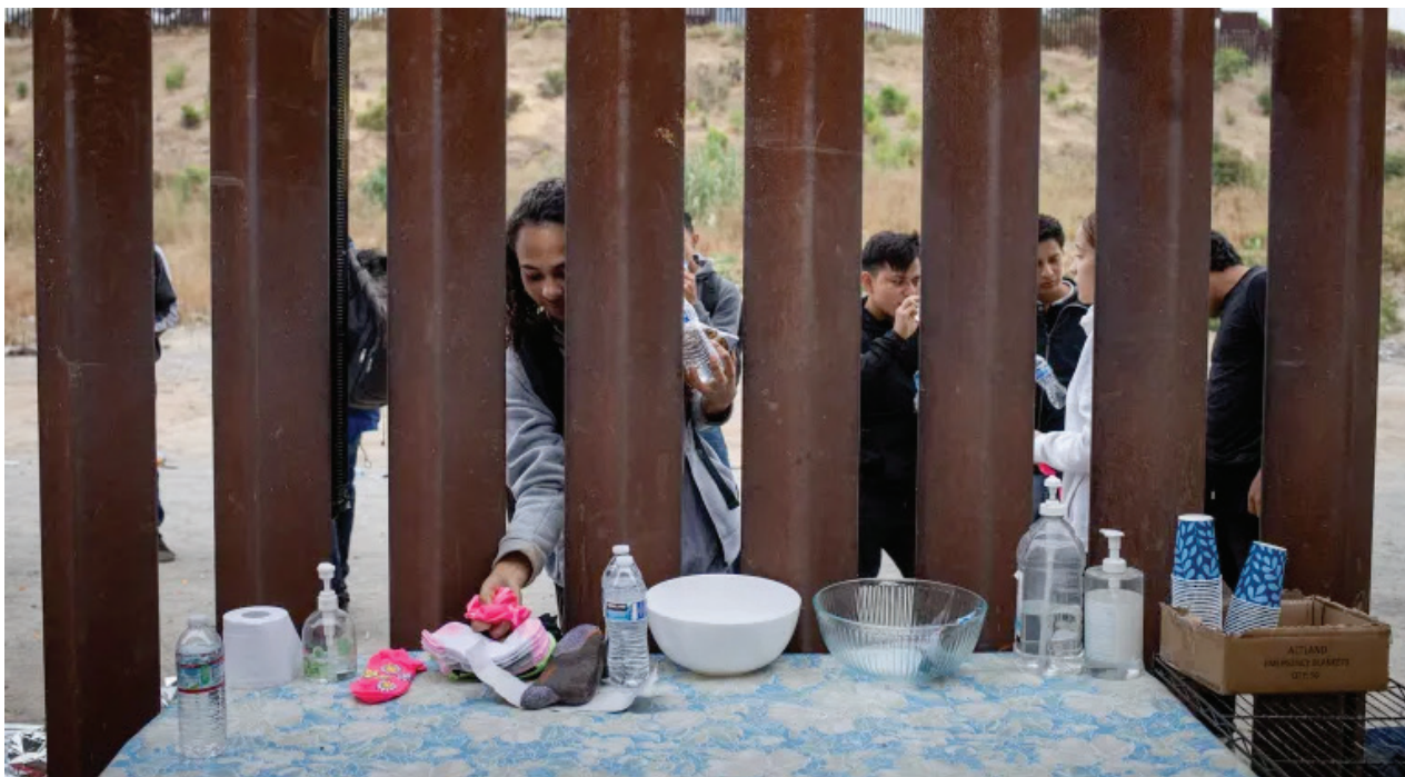
Un solicitante de asilo de Brasil agarra agua y calcetines donados antes de cruzar a los EE. UU. desde México en San Diego. - A Brazilian asylum seeker grabs donated water and socks before crossing into the U.S. from Mexico in San Diego.