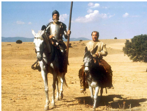
Actores representando El Quijote de Miguel de Cervantes

Miguel de Cervantes Saavedra was born in the city of Alcalá de Henares in 1547, on September 29, in a Spain marked by significant political and cultural changes. Cervantes, the son of a surgeon and from a humble background, spent much of his life under difficult conditions marked by war, poverty, and imprisonment. Despite these challenges, his literary talent flourished, and his pen brought to life