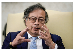
Pres. Gustavo Petro