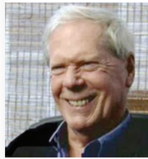
Paul Craig Roberts