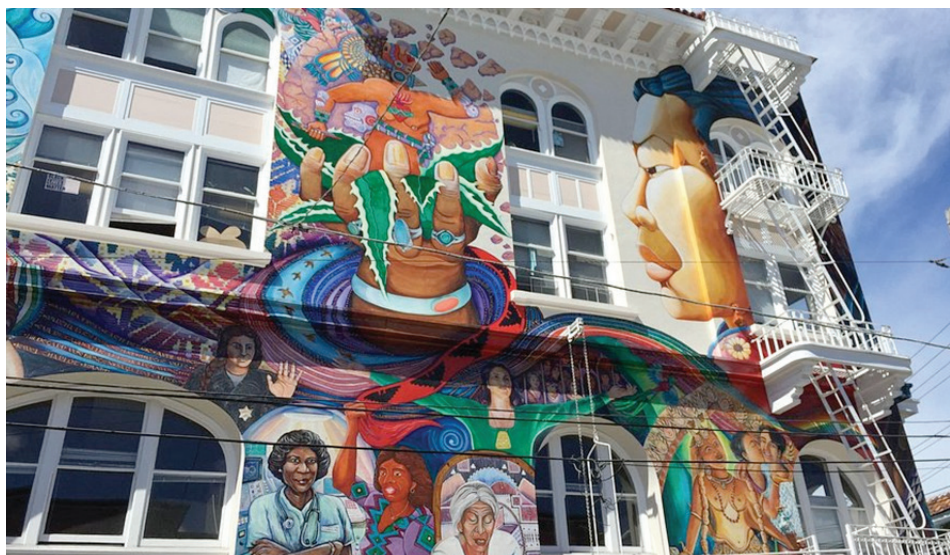
Edificio de Mujeres, SF