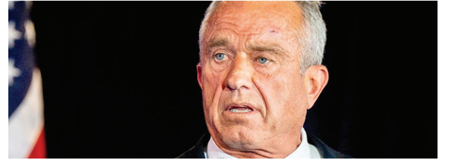
Robert F. Kennedy Jr.

En una reciente entrevista en video, Kennedy fue presionado sobre los niños que se someten a tratamientos transgénero.