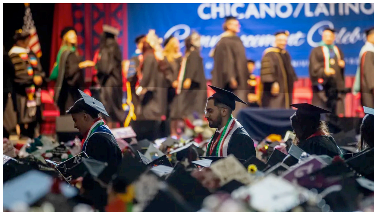
Los estudiantes graduados caminan por los pasillos para recibir sus títulos en la Celebración de Graduación Chicana/Latina del Estado de Fresno en el Centro Save Mart en Fresno el 18 de mayo de 2024.-