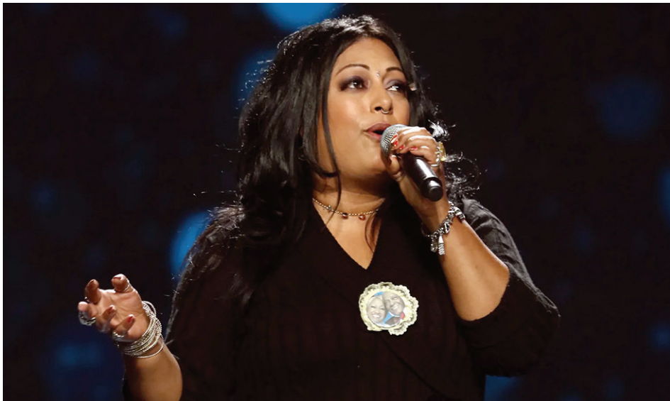
La India ensaya para los Latin American Music Awards 2015. India rehearses for the Latin American Music Awards 2015.