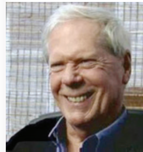
Paul Craig Roberts