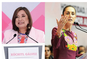
Xóchitl Gálvez y Claudia Sheinbaum