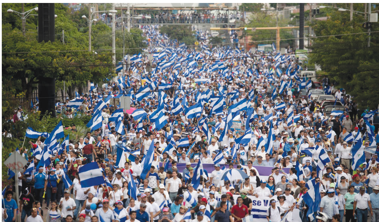
Cientos de miles marchan para pedir la renuncia del gobierno de Daniel Ortega y Rosario Murillo en Nicaragua. Hundred of thousands march asking for the resignation of Daniel Ortega and Rosario Murillo's government in Nicaragua.