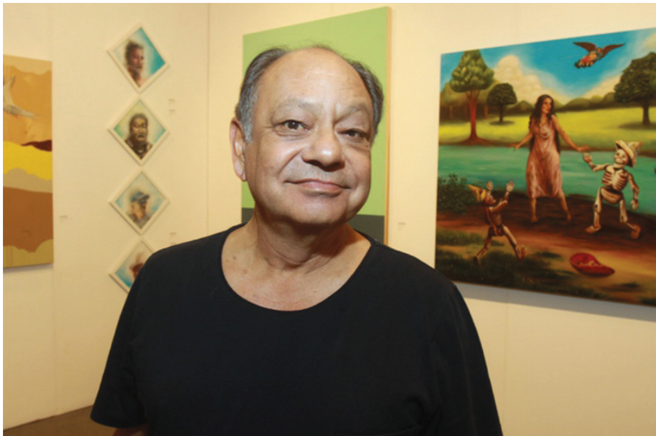
Cheech Marin comparte su Vasta Colección con el Mundo Cheech Marin shares his Vast Collection with the World