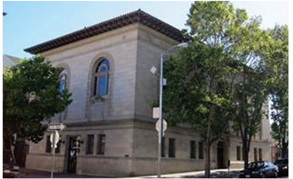
Mission Public Library