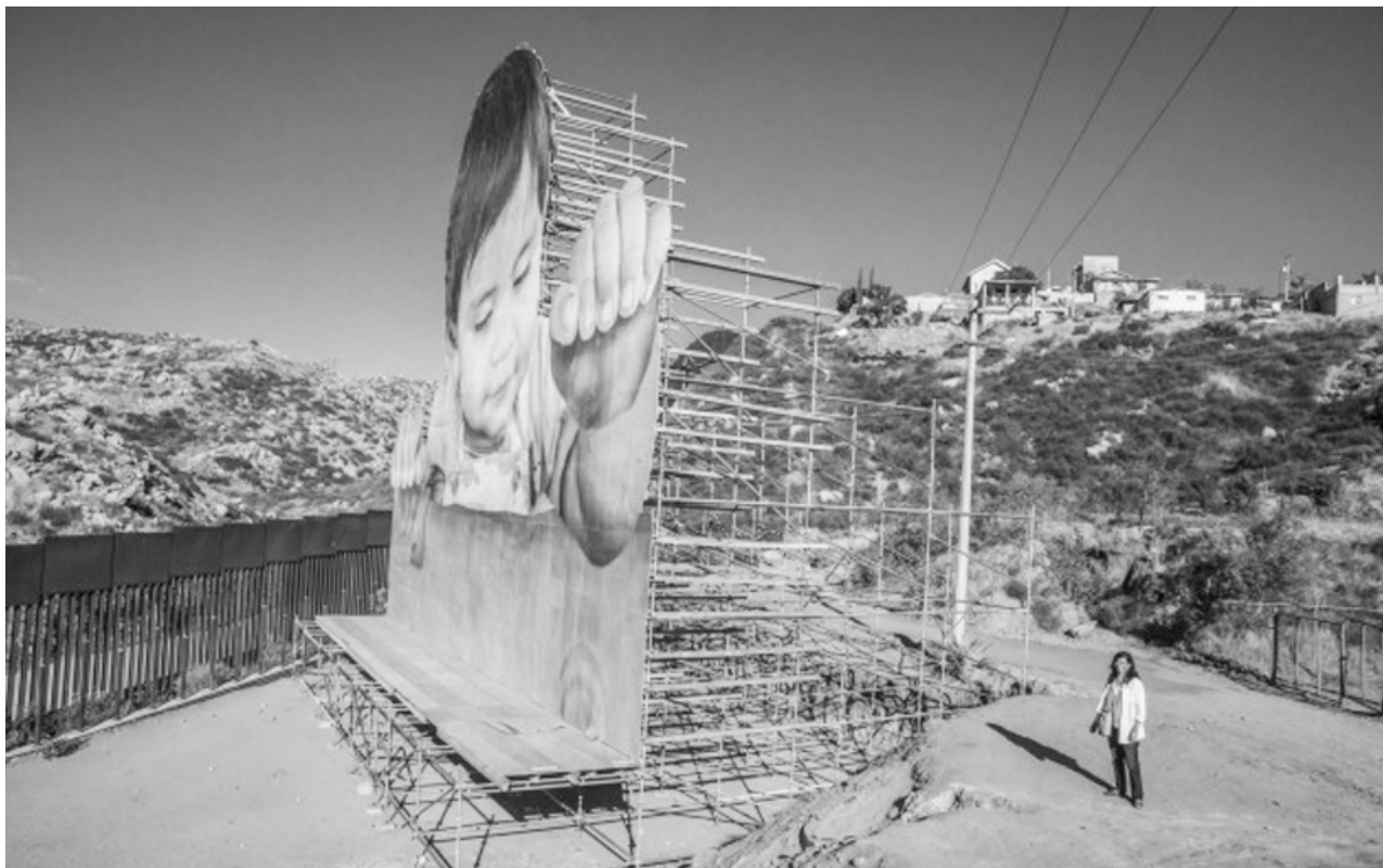
Kikito en la frontera de EE.UU.-México/Kikito at the US-Mexico border