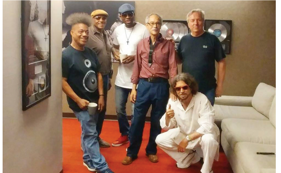
Tribu Jazz Band