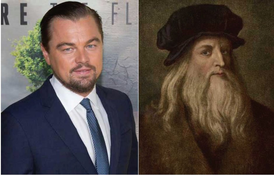
Leonardo Di Caprio