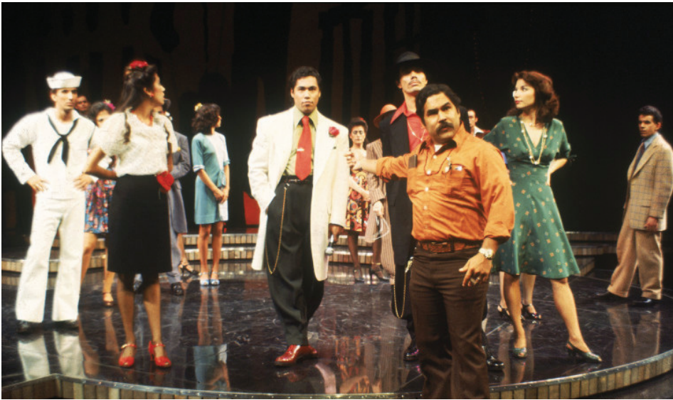
EL Zoot Suit , listo a encender la ciudad otra vez. Zoot Suit , is set to ignite the city again.