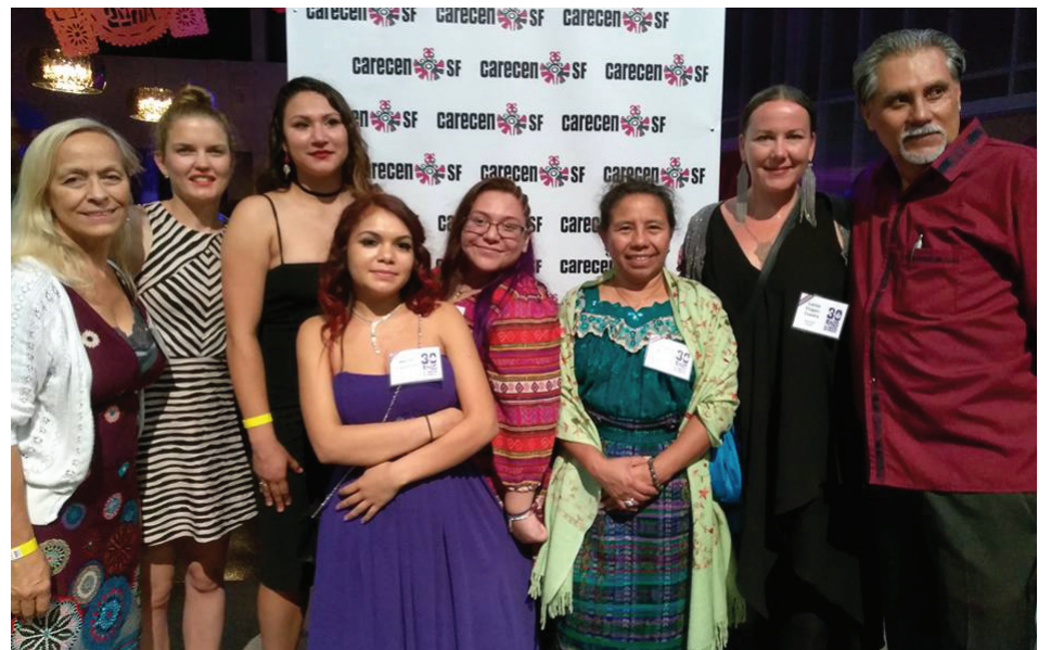
Felicidades a CARECEN en sus 30 años sirviendo a la comunidad inmigrante en SF. Congratulations to CARECEN in its 30 years serving the immigrant community in SF.