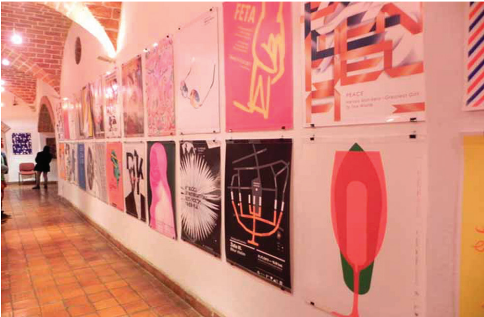
Exhibición Bienal Siart 2016 en Bolivia. Bienal Siart 2016 in Bolivia