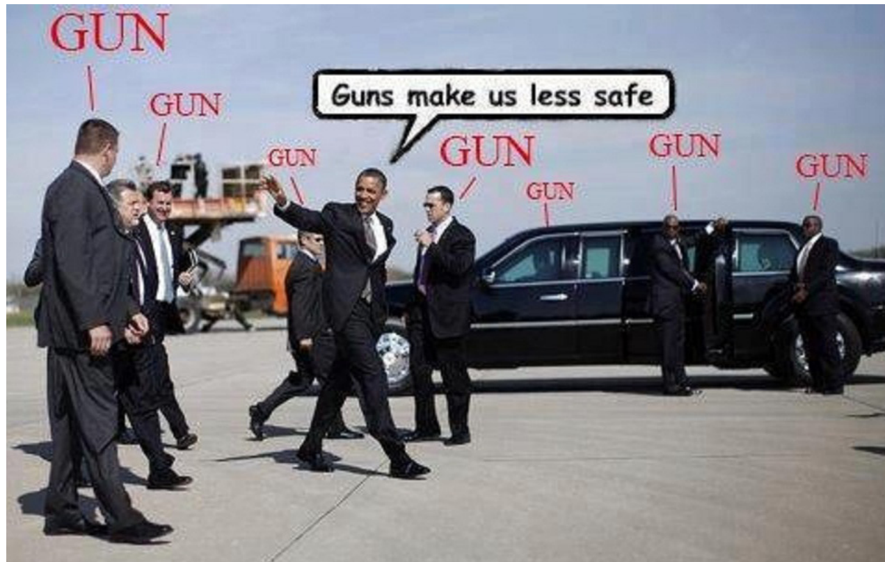
Obama rodeado de sus guardaespaldas armados. Obama surrounded by his armed bodyguards.