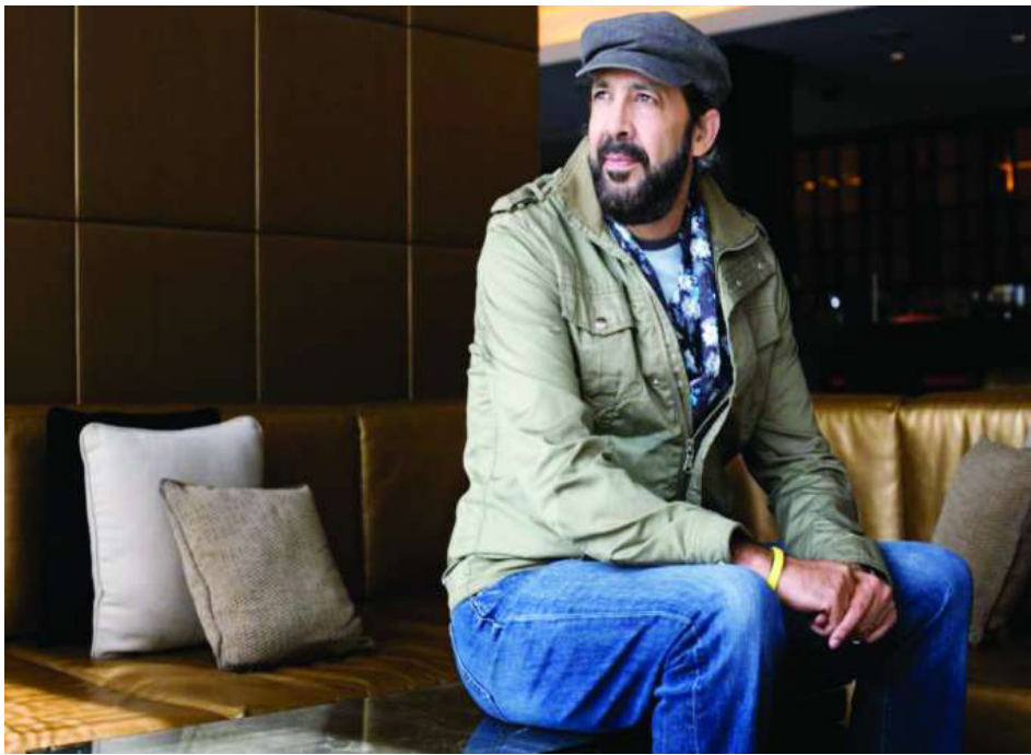
Juan Luis Guerra