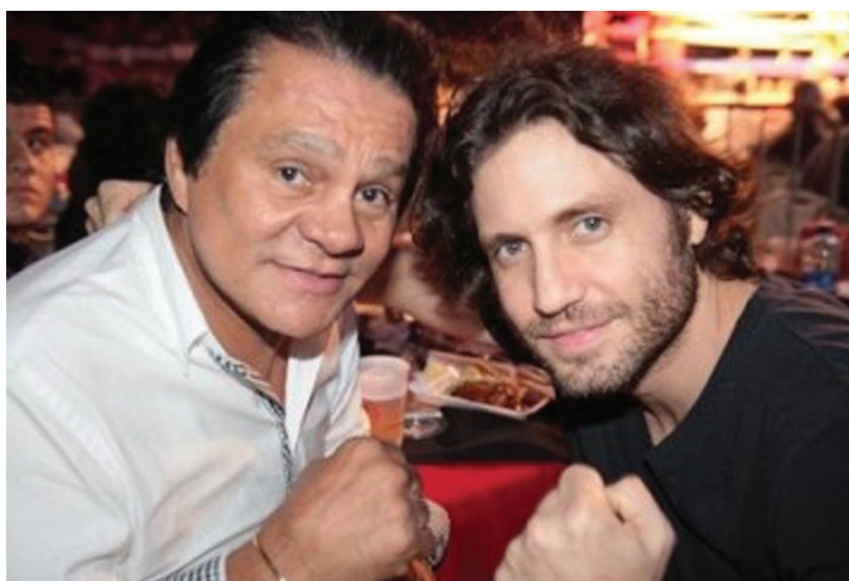
Roberto Durán Manos and Edgar Ramírez