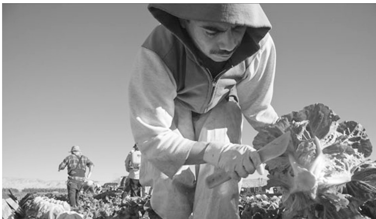
Un trabajador agrícola cosecha lechuga cerca de la Meca, en el valle de Coachella. A farm worker harvests romaine lettuce near Mecca, in the Coachella Valley.