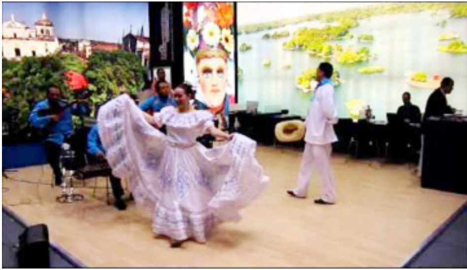
Música nicaragüense. Nicaragua music