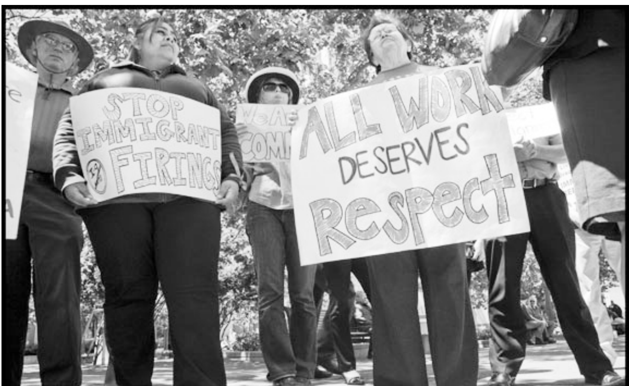
Demostración en frente del edificio federal. Demonstration in front of the Federal Building