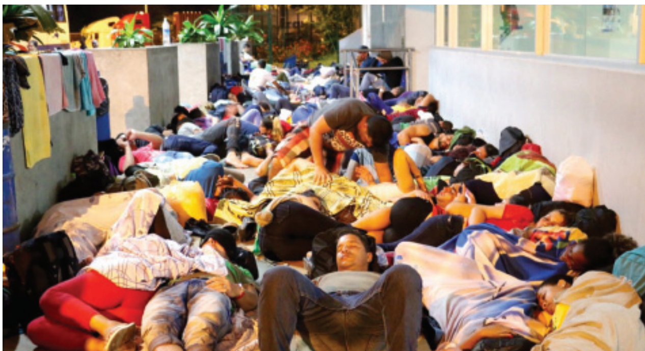
Migrantes cubanos descansan en la frontera Costa Rica-Nicaragua. Cuban migrants rest at the Costa Rica-Nicaragua border.