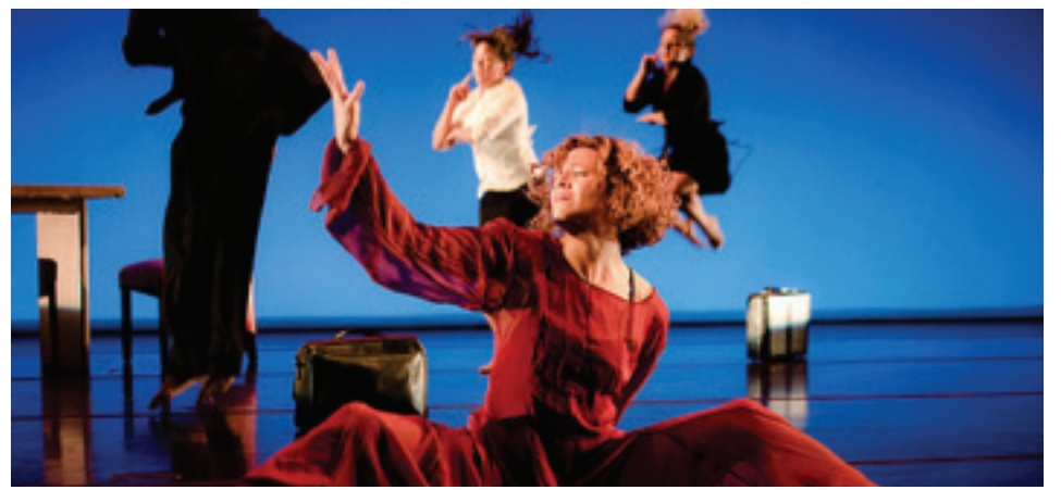
Alayo Dance Company