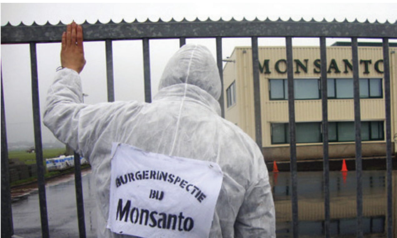
El pleito alega que Monsanto culpable de publicidad falsa reclamando. Suit alleges Monsanto guilty of false advertising.