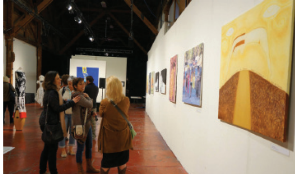
Exhibición de arte de mujeres cubanas. Cuban woman art exhibition.