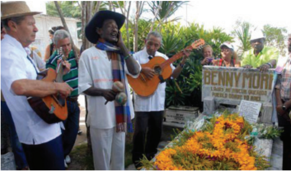
Rindiendo homenaje a Beny Moré en Cuba. Honoring Beny Moré in Cuba.