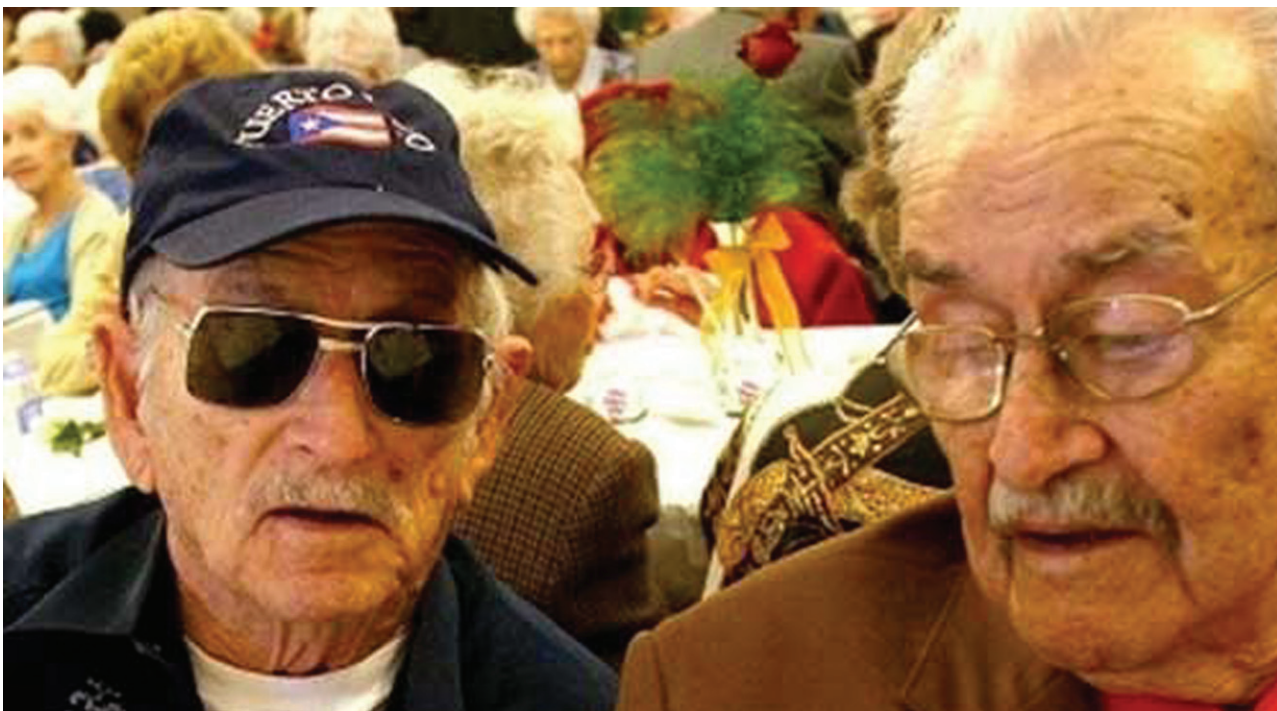
Latinos, como estos hombres, se hacen más susceptibles al abuso de ancianos una vez que entran en centros de cuidado. Latinos, like these men, are becoming more susceptible to elder abuse once they enter care facilities.