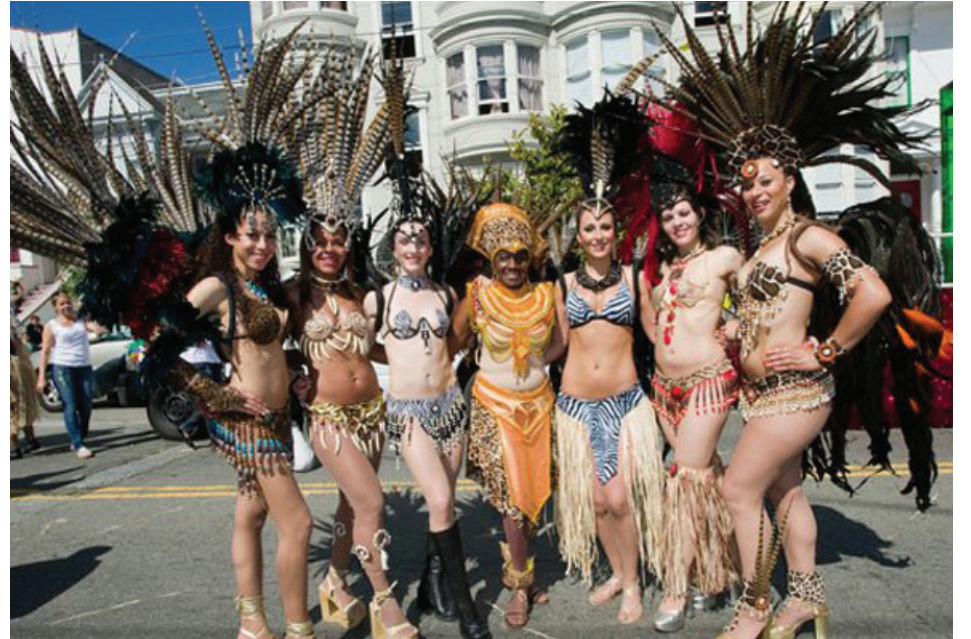
Acuarela Dance Group