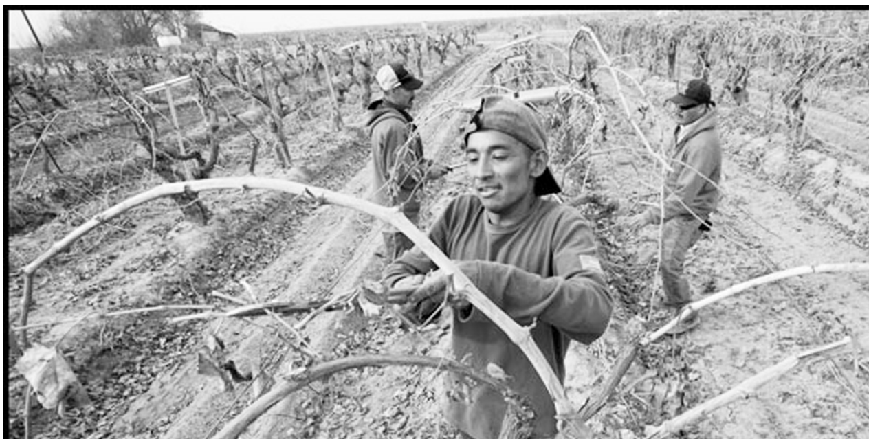
MADERA, CA - Un equipo de trabajadores de Oaxaca poda las vides que cultivan uvas para pasas, en un campo cerca de Madera. A crew of farm workers from Oaxaca prunes the vines that grow grapes for raisins, in a field near Madera.