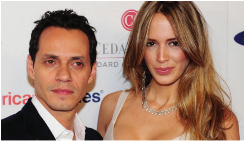
Marc Anthony and Shannon de Lima