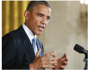
Pres. Barack Obama