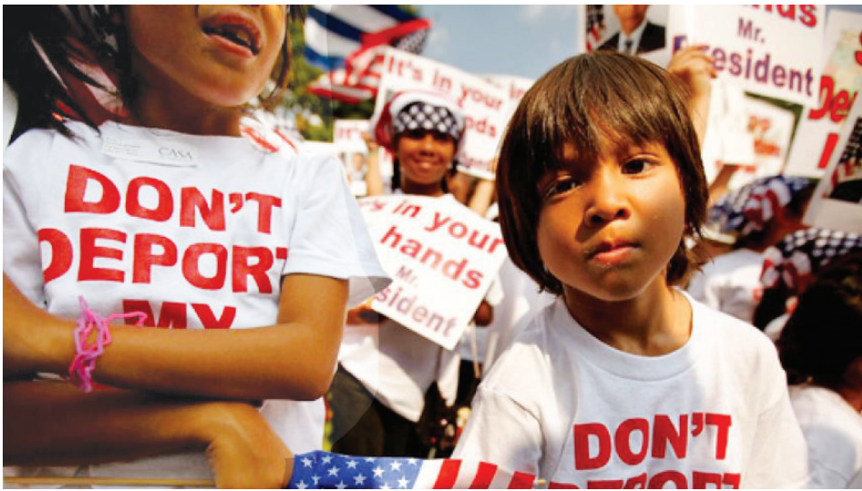
Niños inmigrantes. Immigrant children.