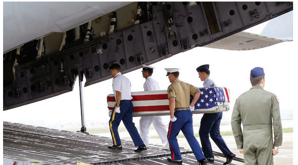
Un ataúd con un veterano regresa a casa. A casket with a veteran returns home.