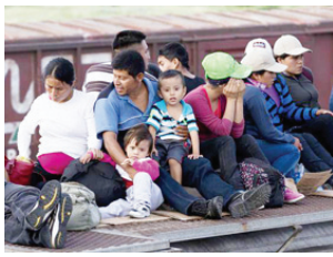
Immigrants van en el tren. Immigrants ride the train