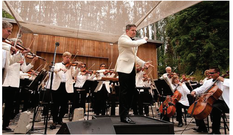
San Francisco Symphony