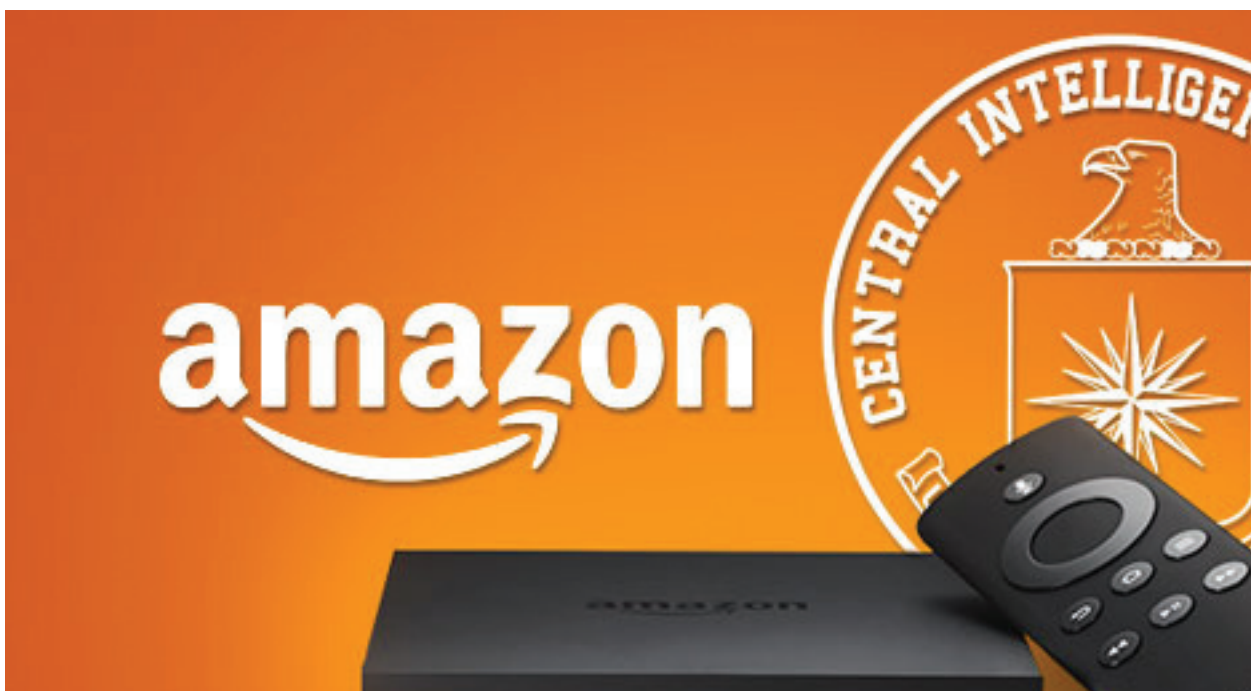
Ilustración de la alianza entre Amazon y la Agencia Central de Inteligencia. Illustration of the alliance between Amazon and the CIA.